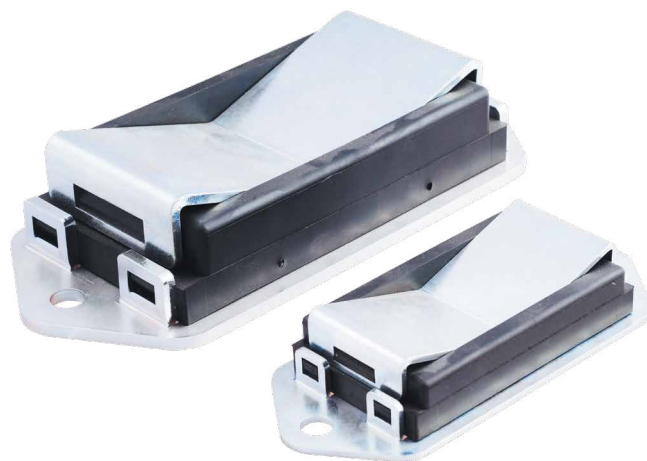
ANITVIBRATION PADS - TECHNICAL SPECIFICATIONS