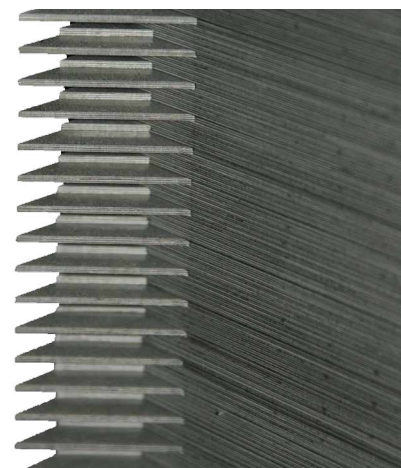
Step Lap 45°