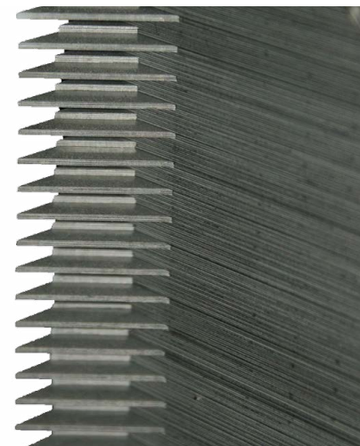
Step Lap 45°